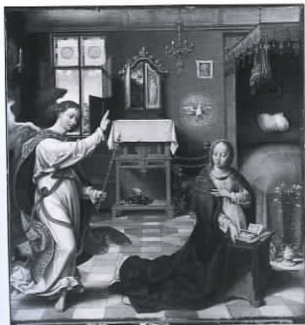
43 De aankondiging van Christus' geboorte door Joos van Cleve (Metropolitan Museum of Art, New York)