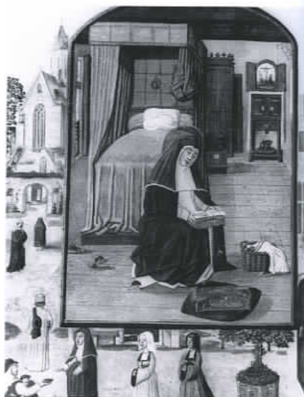
42 Miniatuur met de heilige Gertrudis in haar kamer (Nationale Bibliotheek, Wenen)

De opkomst van de Reformatie en het bijbels humanisme leidde tot een nieuwe kijk op en interpretatie van de bijbel. Een weerspiegeling van deze ontwikkeling is te vinden in het Nederlandse interieur. In de middeleeuwen