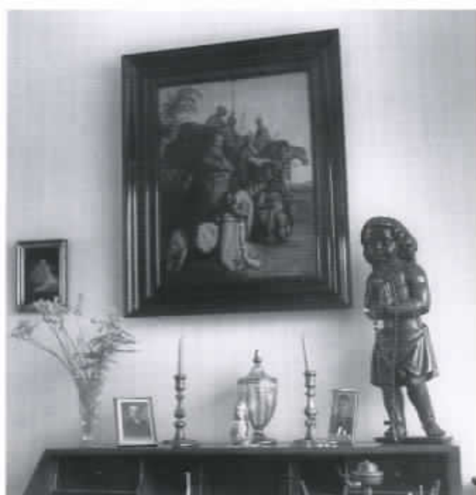
38 Huiskamer waarin Rembrandts Doop van de kamerling nog aan de wand hangt

Een speciale plaats namen die voorstellingen in, die een beledende en vermanende functie hadden. Zo herinnerde een afbeelding van een schedel in gezelschap van een