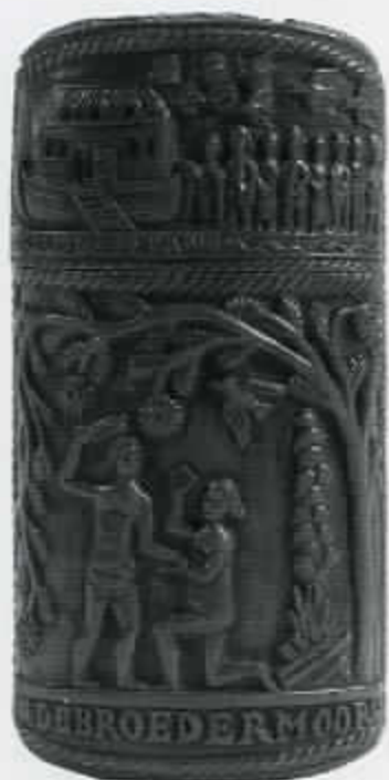
51 Doosje met de broedermoord, daarboven de ark van Noach (cat. nr. 47)