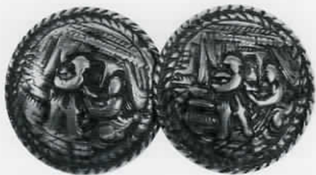
60 Hindelooper mangelbak met Tobias en de engel (cat. nr. 159)