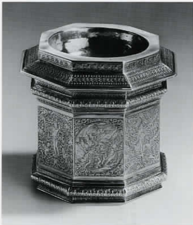
50 Zoutvat met de geschiedenis van Lot: Lot vlucht uit het brandende Sodom (cat. nr. 29)