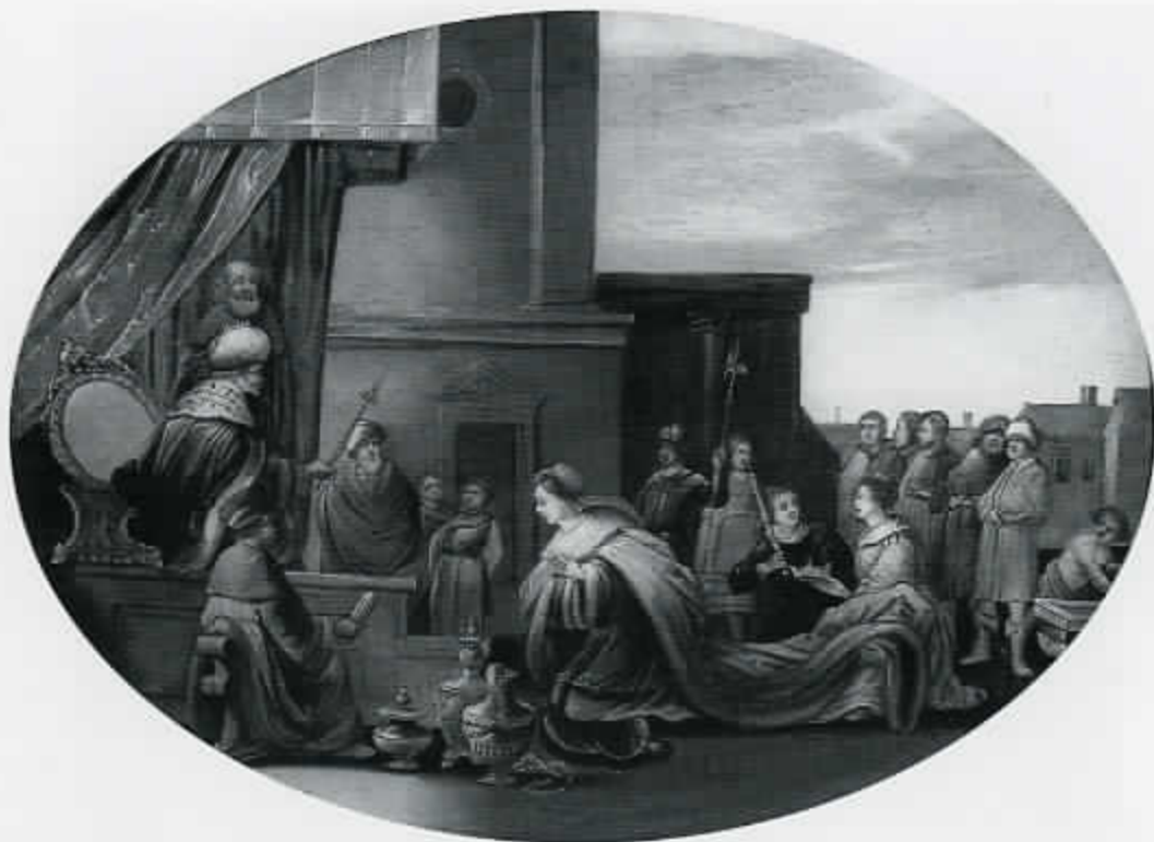
58 De koningin van Scheba bezoekt koning Salomo (cat. nr. 103)

waren van het Lucasgilde, zich soms aan het maken van echte schilderijen. Er is namelijk een aantal paneel-schilderijtjes bewaard, waarbij de verf direct op het hout is aangebracht en niet op een van te voren met een grondlaag geprepareerd paneel, zoals gildevoorschrift was. De uitbeelding van de taferelen op deze paneeltjes is doorgaans spontaan en ongekunsteld en sluit aan bij de stijl van de beste meubelen. Waarschijnlijk hebben deze 'amateur' schilderijtjes de wanden gesierd van hen, die een echt schilderij niet konden of wilden betalen (afb. 58).