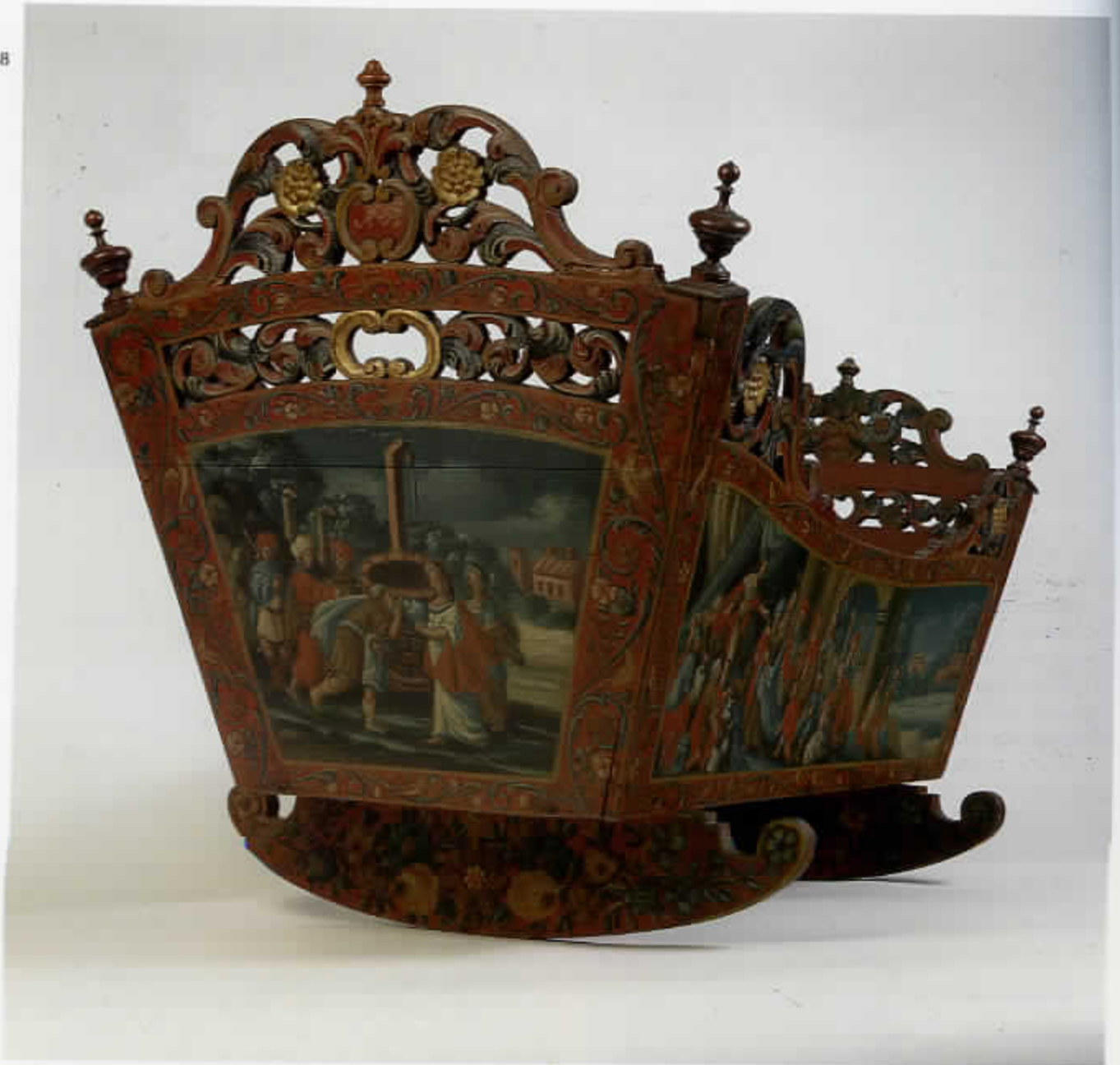
64 Hindeloooper wieg met op het hoofdeinde Rebekka geeft de knecht van Abraham te drinken en op de rechterzijkant de koningin van Scheba bezoekt koning Salomo (cat. nr. 120)