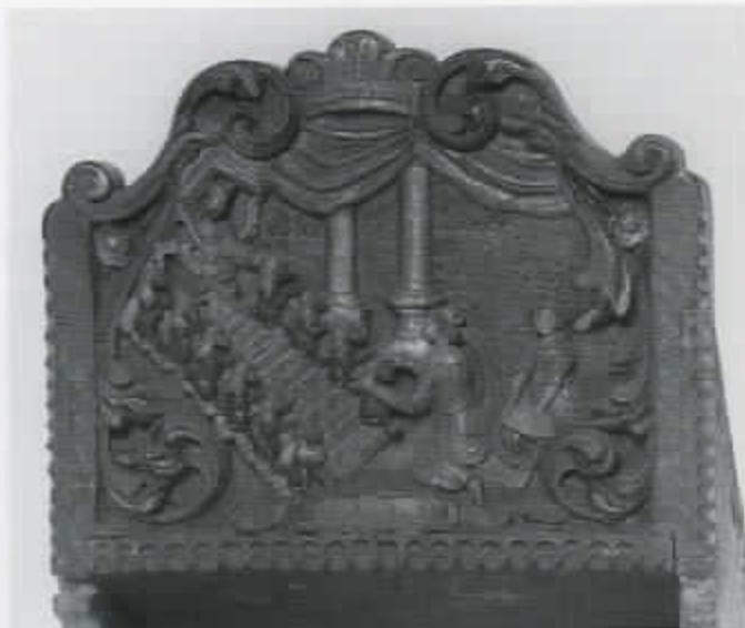
63 'Ester bezoekt Salomon', bijschrift bij een voorstelling op een Hindelooper prikslede

De opkomst van niet-devotionele bijbelse voorstellingen in het interieur hangt samen met het bijbels humanisme, een geestelijke stroming, die de christelijke traditie met de cultuur van de oudheid poogde te verzoenen en die haar opmars begon gelijktijdig met de Reformatie. Dit bijbels humanisme was aanvankelijk vooral te vinden in