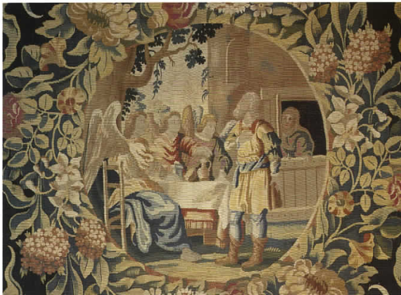
39 Het bezoek van de drie engelen aan Abraham. Detail van een tafelkleed (cat. nr. 37)

Christus was de wereld immers verlost en was een nieuwe periode van de heilsgeschiedenis begonnen. De belofte van God aan Zijn volk, dat Hij hen zou bevrijden, was ingelost en het Oude Testament was voortaan nog slechts een voorspel en een voorafbeelding van het Nieuwe Testament. Tegelijkertijd met de opkomst van het humanisme kwam hierin verandering. Men ging in de boeken van het Oude Testament waardevolle geestelijke lessen ontdekken; de verhalen van de aarts vaders, profeten en koningen lieten net als de geschiedenis van Jezus zien hoe men een zedelijk hoogstaand leven moest leiden. De bijbel werd in zijn geheel serieus genomen. Dit was vooral het geval bij degenen, die de kerk wilden hervormen, zoals Luther en andere reformatorisch gezinden. Velen, speciaal in kringen van meer geleerden, kenden aan de verhalen uit de bijbel en uit de klassieke oudheid een gelijke voorbeeldige waarde toe. Zij worden bijbelse humanisten genoemd. Hun meest bekende vertegenwoordiger is Erasmus. Het is deze geesteshouding die in de 16de maar ook nog in de 17de eeuw de gedachtenwereld van