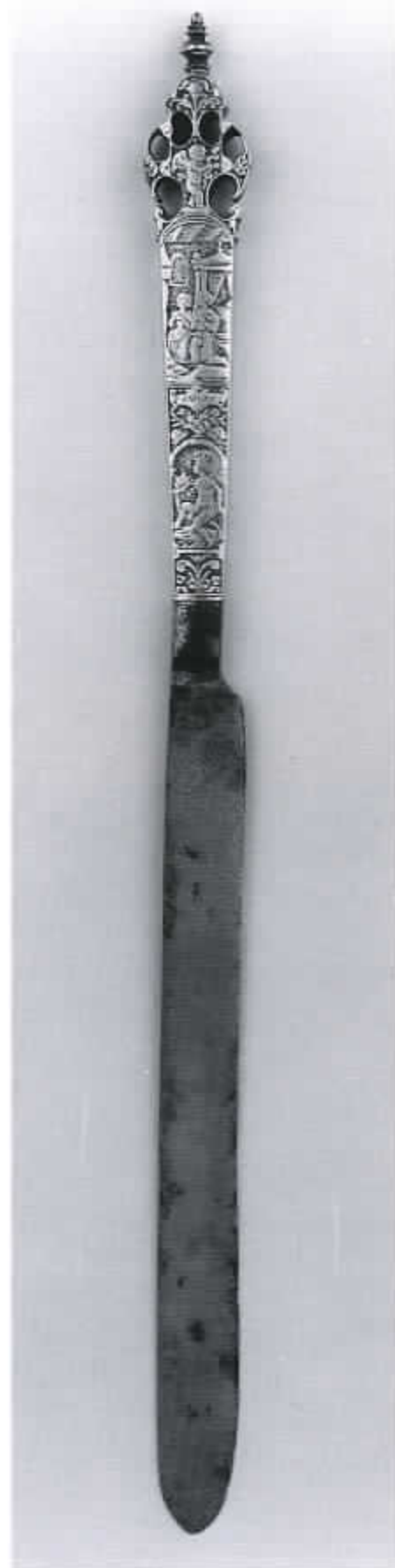
49 Mes met de biddende Tobias en Sara voor hun huwelijksbed (cat. nr. 33)

De hierboven genoemde kostbare gebeeldhouwde kasten, het fraaie zilver en ook de geweven veelkleurige tapijserieën, de damasten tafellakens en het sieraardewerk waren vanzelfsprekend alleen te vinden bij de welgestelden. Juist in dit welvarende en geleterde milieu bloeide het bijbels humanisme en de onderwerpskeuze voor de decoratie van het huisraad geeft hiervan een goede getuigenis. Omdat er minder gebruiks-