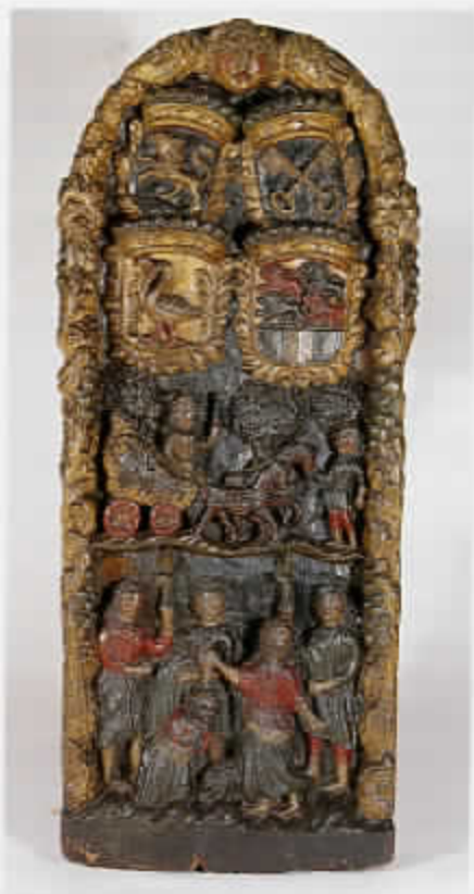
62 Mastschild van een veerboot met voorstelling de doop van de kamerling (cat. nr. 5)

Suzanna's eerste plaats als voorbeeldige vrouw lijkt te worden ingenomen door de figuur van koningin Ester die op vele Hindelooper en Zaanse kisten en kistjes wordt afgebeeld. Zo zijn vier taferelen uit het leven van Ester