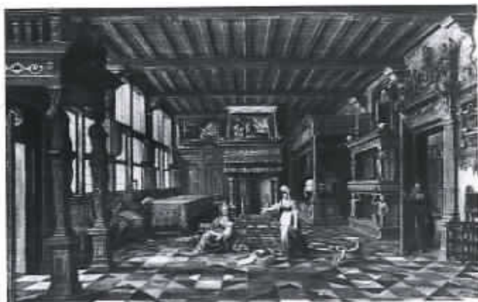
45 Interieur met bijbelse voorstellingen (Sotheby's, Amsterdam)