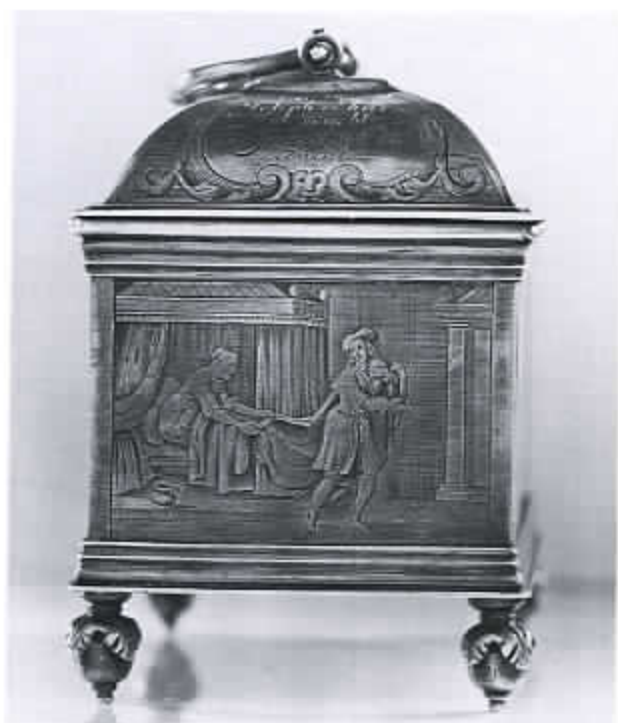
48 Knottekistje met o.a. Jozef vluchtend voor de vrouw van Potifar (cat. nr. 34)

Overigens is het typerend dat men vaak bij voorkeur niet een voorbeeld van deugd in beeld bracht, maar juist van het tegenovergestelde, van wat men als christen juist geacht werd niet te doen. Zoals door alle eeuwen heen gaf de afbeelding van het slechte en verkeerde kennelijk