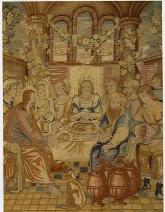
56 Tapiserie met de bruiloft te Kana (cat. nr. 36)