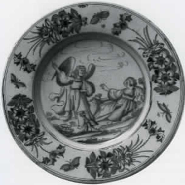
53 Delftse schotel met de vertroosting van Hagar in de woestijn (cat. nr. 53)