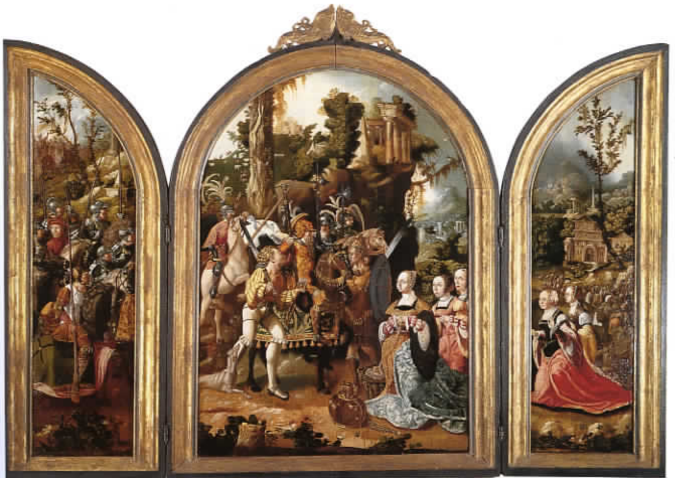
41 Drieluik met de ontmoeting tussen David en Abigail. School Jan van Scorel (cat. nr. 7)