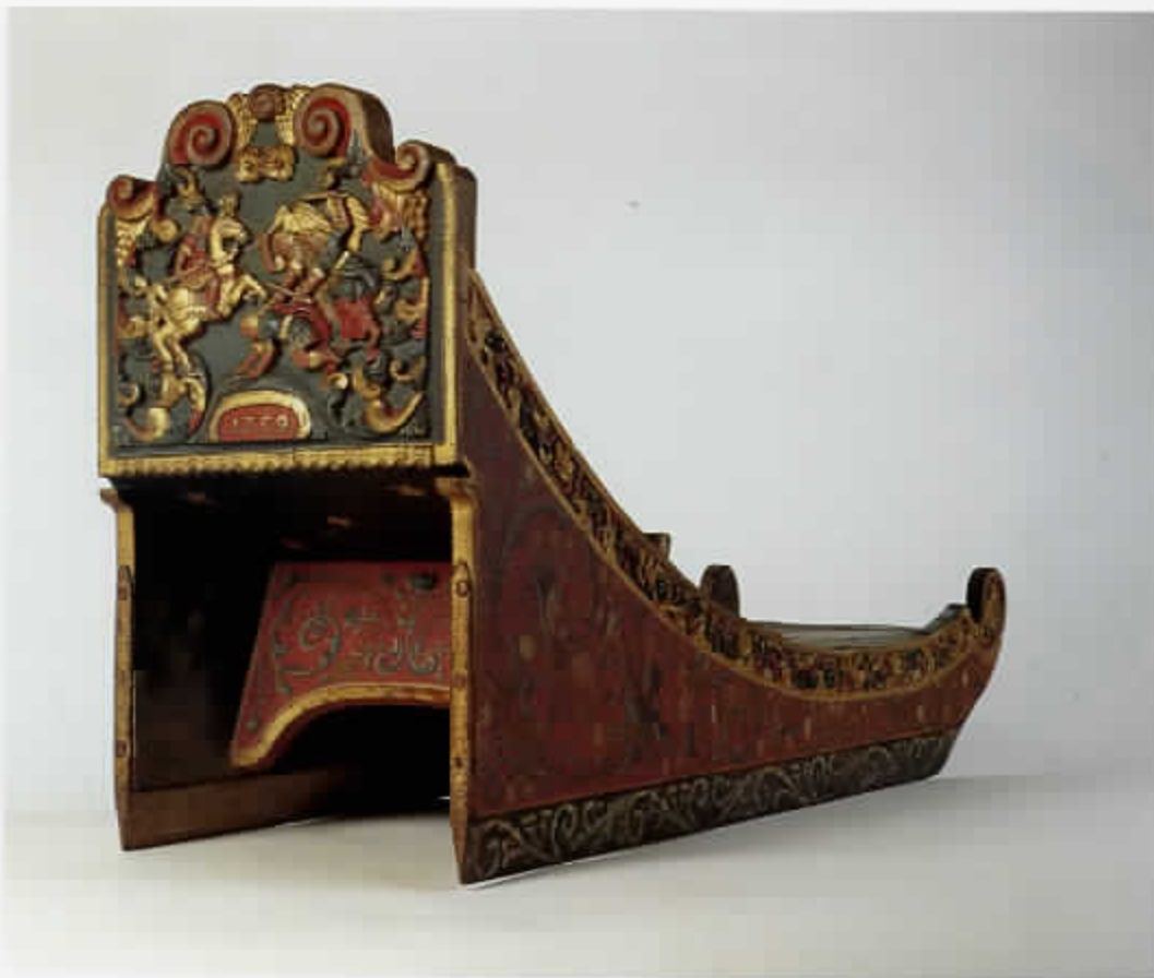
61 Prikslede met een voorstelling uit de Makkabeeën: de verdrijving van Heliodorus, de tempelrover (cat. nr. 161)

eeuwse moraliserende betekenis (afb. 59).