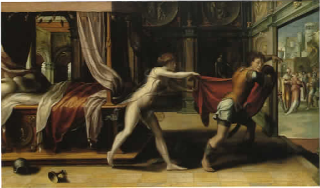
40 Jozef vluchtend voor de vrouw van Potifar. Pieter Coecke van Aelst (cat. nr. 8)