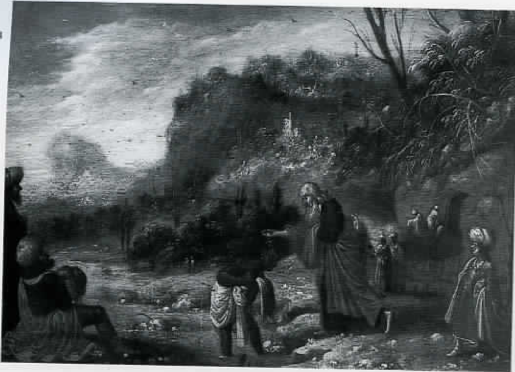
57 Rombout van Troyen, De doop van de kamerling (cat. nr. 2)

voorwerpen bewaard zijn gebleven van de wat lagere sociale lagen van de burgerij, is het moeilijker zicht te krijgen op de populariteit van de bijbelverhalen daar. Op eenvoudiger schilderijtjes, zoals onder andere een schilder als Rombout van Troyen die vervaardigde (afb. 57), zijn dezelfde onderwerpen te zien als op die in de kring van Rembrandt werden geschilderd. Eenvoudiger aardewerk uit het midden van de 17de eeuw toont eveneens de populaire geschiedenissen met onder andere de vluchtende Jozef, de geschiedenis van Juda en Tamar en Christus en de Samaritaanse vrouw.