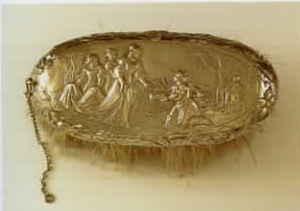
54 Borstelrug met de redding van Mozes (cat. nr. 35)