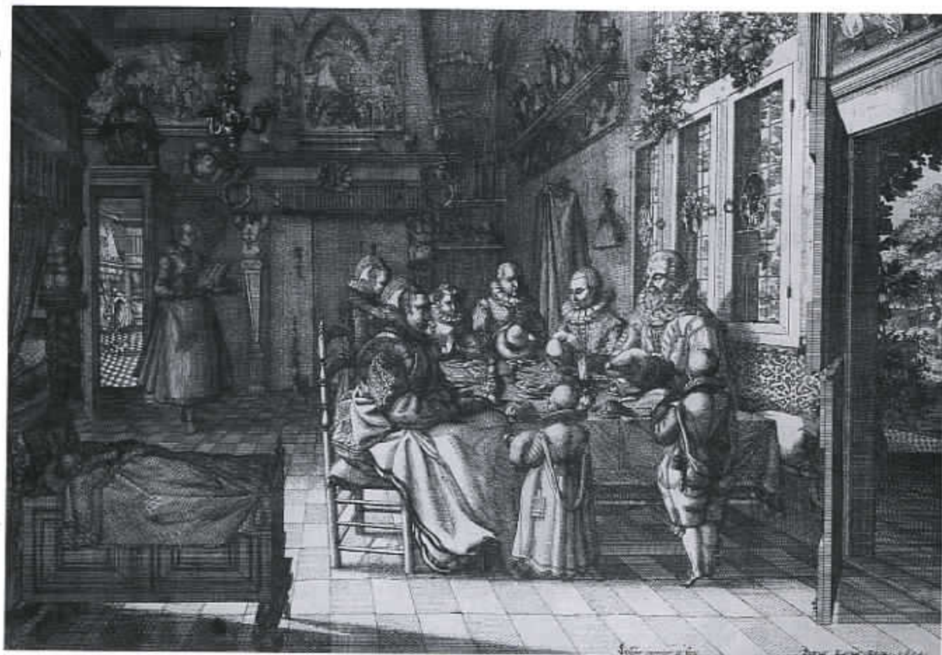
47 Biddende familie aan tafel (Psalm 128) door Claes Jansz. Visscher (cat. nr. 12)

afgebeeld op een zilveren knottekistje uit het midden van de 17de eeuw (afb. 48), een voorwerp dat een vrijer schonk aan zijn uitverkorene. Zo'n trouwkoffertje was bij uitstek geschikt om toepasselijke bijbelse taferelen op te graveren. Behalve Jozef zijn dan ook de kuise Suzanna maar ook de bruiloft te Kana en een voorstelling van David en Batseba te zien. De bedoelingen van deze voorstellingen werden nog eens extra toegelicht in de opschriften: 'Joseph is hier de Jeucht, Een spiegel tot de deucht', 'Susanae's Kuysheit stralen geeft, Soo wert een Reyne echt beleeft', 'Geluckich moet de bruyloft sijn, daar Christus maeckt van water wijn' en 'Als 't ooghet hert verleyt, wort dick te laet beschreyt'.