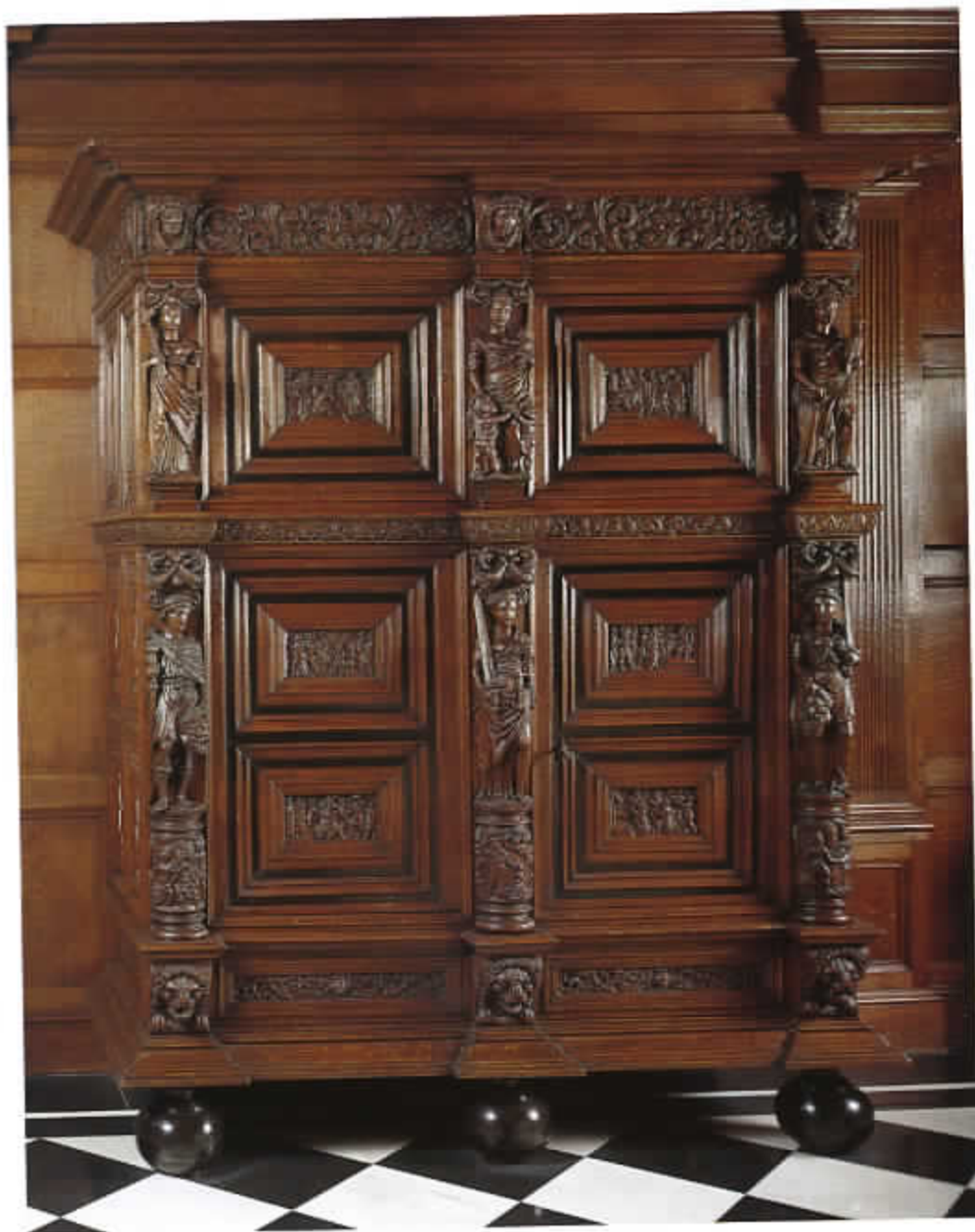
46 Beeldenkast met op de panelen de geschiedenis van Suzanna (cat. nr. 43)