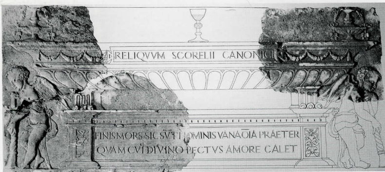
Reconstructie van de tekst op de grafsteen, op grond van de tekening van Buchelius

gens is tussen 1813 en 1816 het schip gesloopt en in 1844 tenslotte de koorpartij. Alleen de kloostergang bleef grotendeels gespaard. Het terrein dat door de afbraak vrijkwam, nu 'Mariahoek' geheten, is gedeeltelijk bebouwd. Daar verrees in 1738/1739 onder andere het Aalmoezeniershuis, de voorganger van de Oud-Rooms-Katholieke Aalmoezenierskamer.