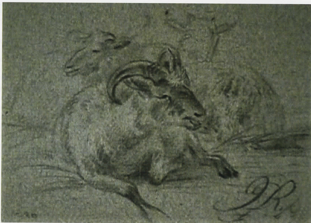
James de Rijk, Bok en schapen, 1825, zwart krijt op grijs papier. (Collectie Hilversum)

Een van die schetsen in de Collectie Hilversum, gesigneerd en gedateerd 1824, toont een liggende bok, die identiek is aan de bok op het grote schilderij en op het schetsje aan de muur van het atelier van Pieter Fredrik