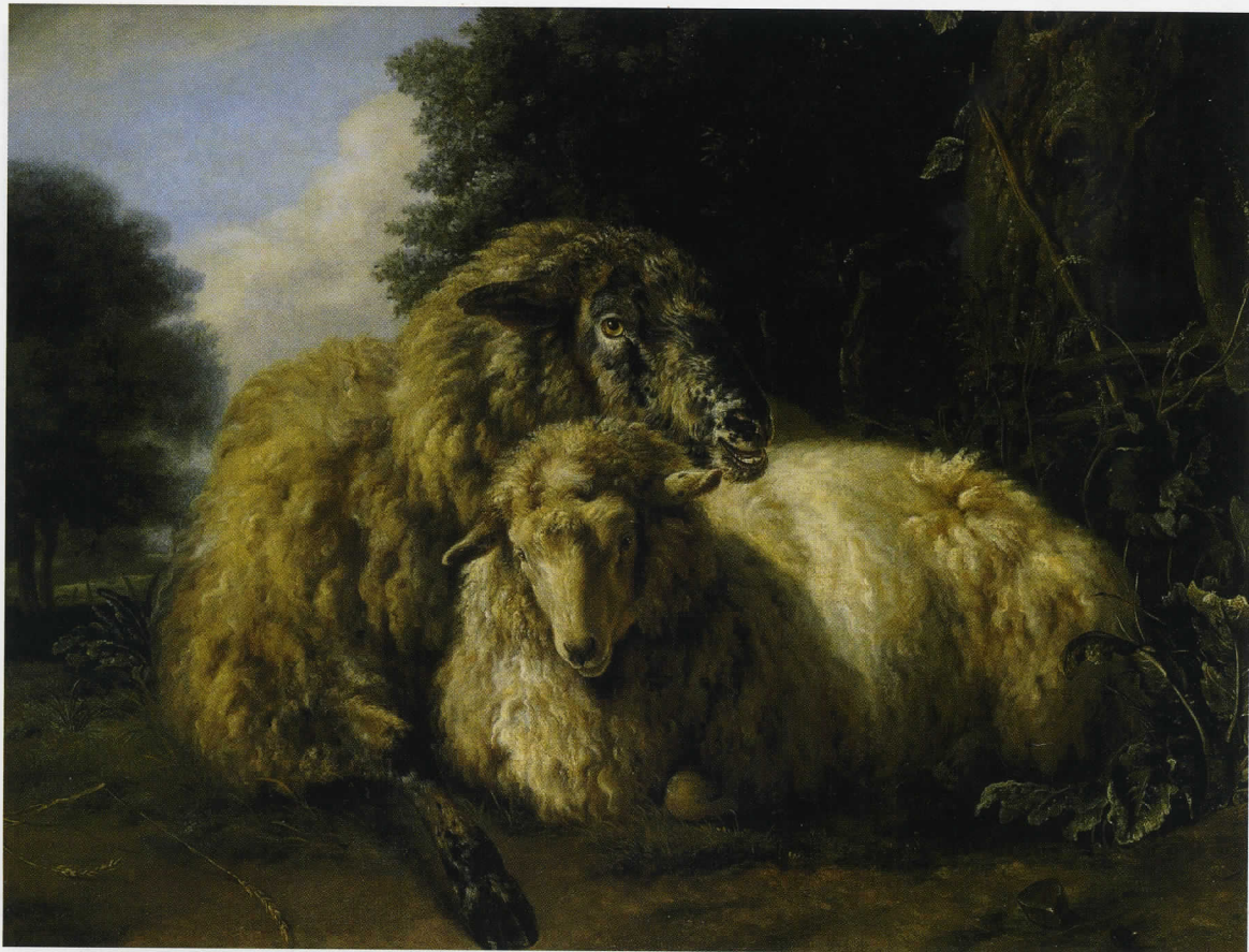
Pieter Gerardus van Os, Twee liggende schapen, olieverf op paneel, 120 x 164 cm. (coll. Kunstmuseum Den Haag)

en net als deze ging hij schetsen maken van schapen en ander vee. Een groot aantal is bewaard gebleven. Zij zijn vaak nauwelijks te onderscheiden van die van Van Ravenswaay. 7