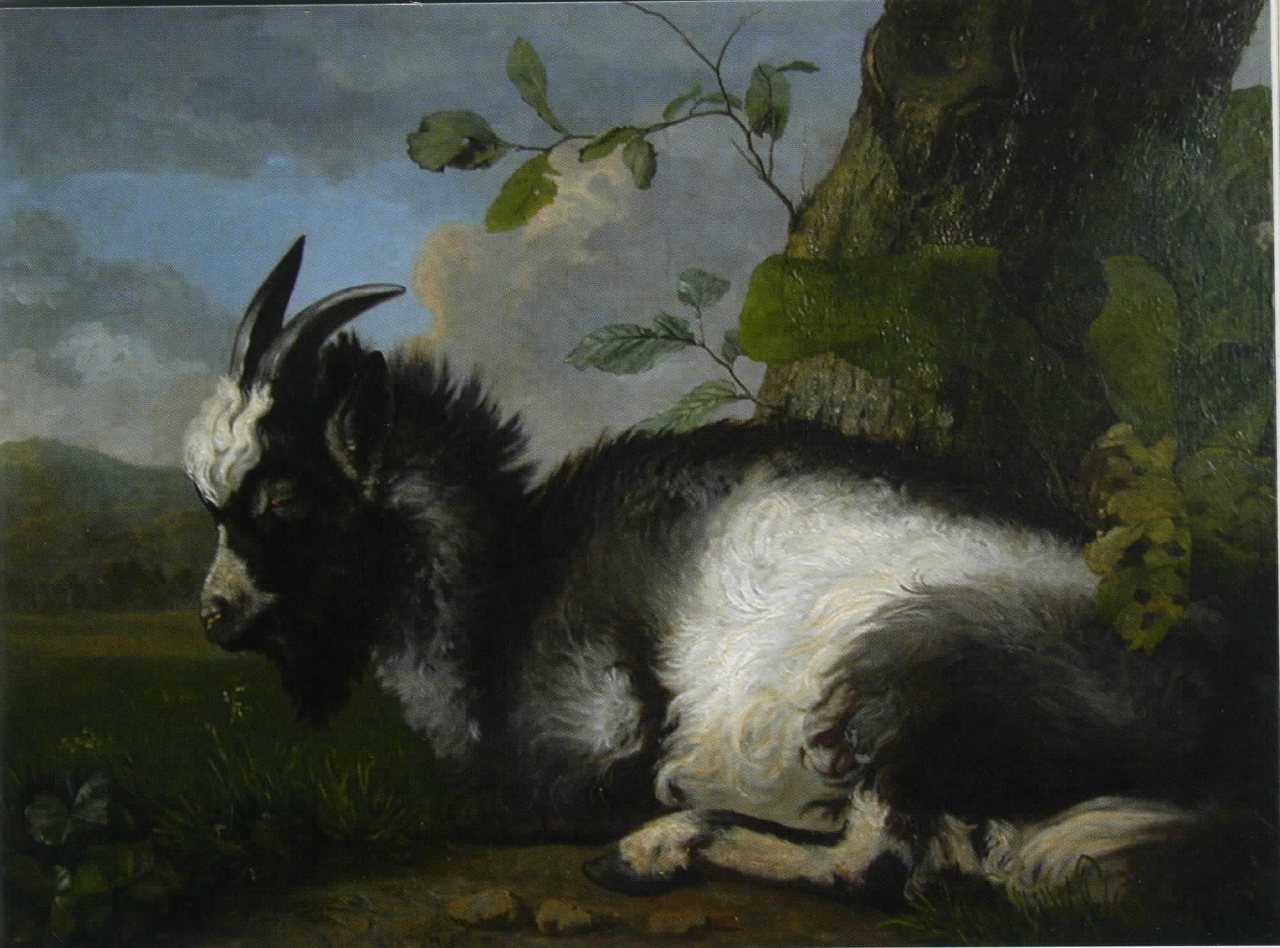
James de Rijk, Liggende bok, 1826, olieverf op doek, 65.5 x 88 cm. (particuliere verzameling)