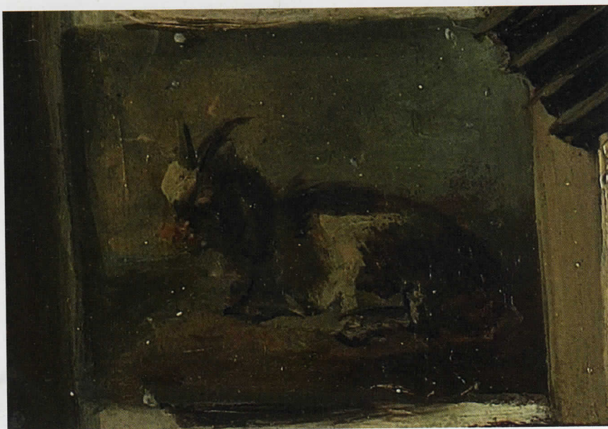
Anton Mauve, Atelier van Pieter Frederik van Os , detail.

neer je bedenkt, dat de maker nog geen 18 jaar oud was. Geweldig goed heeft hij het glimmende leer van de stoel weergegeven, als ook de glans van de aardewerken pot daarop. Alle details zijn met vlotte penseelstreken over-