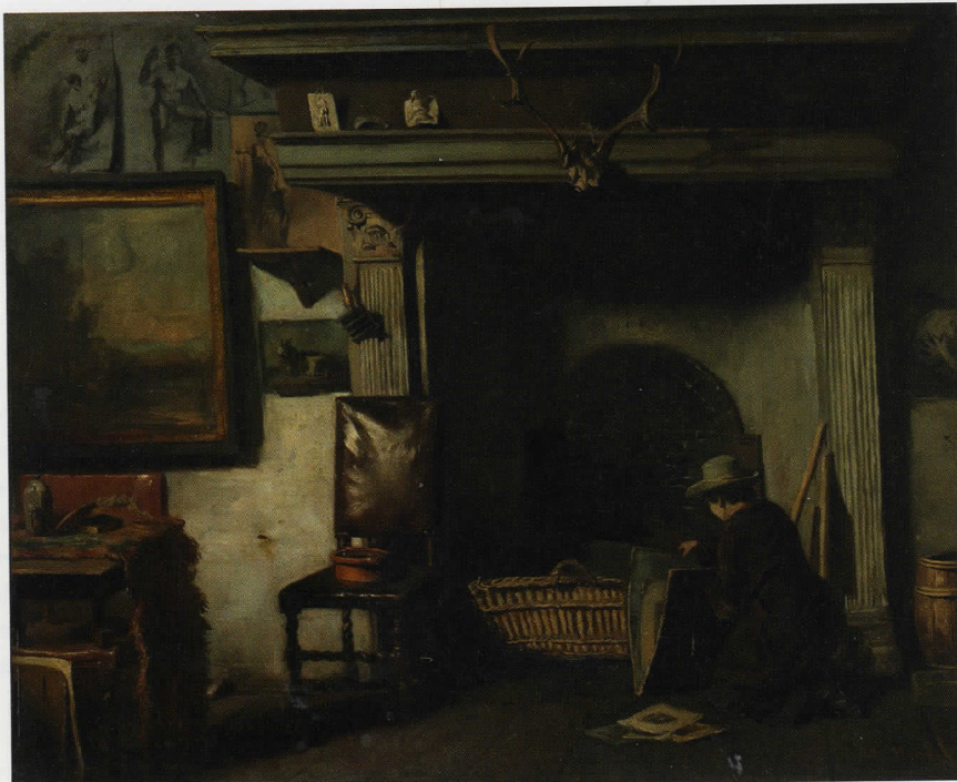
Anton Mauve, Atelier van Pieter Frederik van Os, ca. 185-1856, olieverf op papier, 49 x 61 cm.

oprichters van de Larense School. Van 1854 tot 1857 was Mauve in de leer bij Pieter Fredrik van Os en in die jaren heeft hij het interieur van het atelier van zijn leermeester geschilderd. Het is een knappe studie, vooral ook wan-