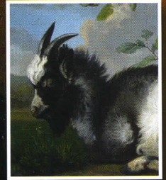
Een liggende bok