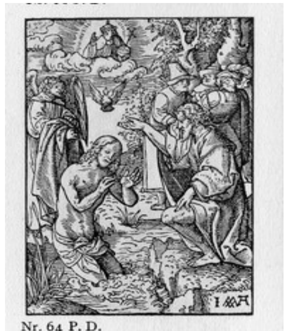
Nr. 64 P. D.