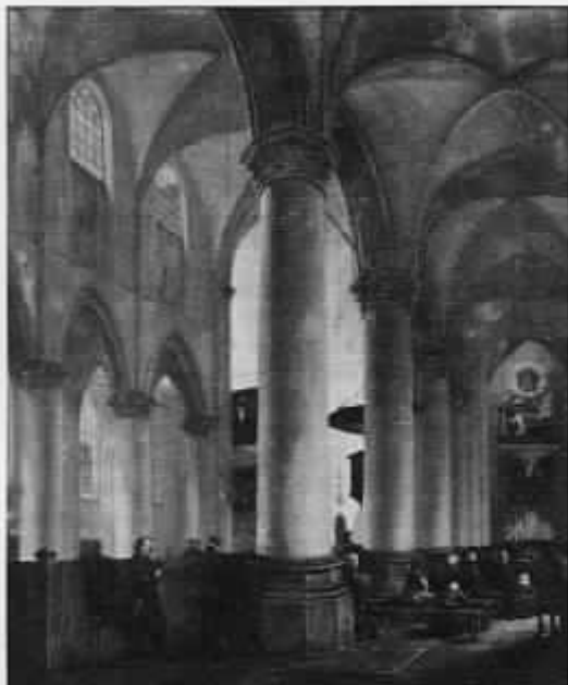
Gezicht in de St. Catharinakerk vanuit het zuid-westen. A. W. Nieuwenhuizen 1843. Olieverf op doek, 51,5 x 43 cm. Particuliere verzameling.