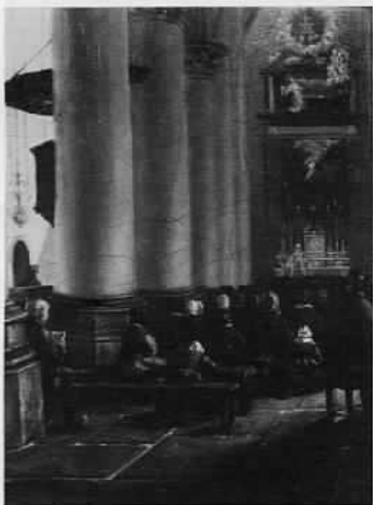
Gezicht in de St. Catharinakerk vanuit het zuid-westen. A. W. Nieuwenhuizen, detail.

vond het zich in het begin van onze eeuw in Utrechts particulier bezit. Het schilderij, dat was gesignd en gedateerd „A. W. Nieuwenhuizen Ao 1843“, toonde de kerk gezien vanuit de zuid-westelijke zijbeuk naar het oosten. Boven het altaar van het zuidertransept hing een schilderij met de verrijzenis van Christus en daarboven een ander tafereel. In het middenschip zag men de oude lichtkronen en de preekstoel, boven het altaar in het noordtransept twee schilderijen met respectievelijk de geboorte van Christus en de kruisiging en tegen de noordelijke muur van dit transept een beeld van Catharina.